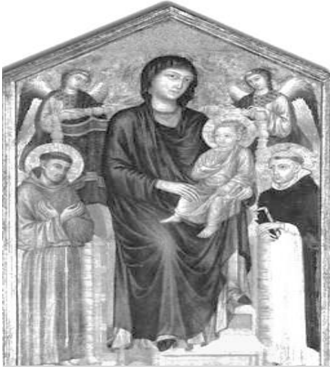
Na imagem, Madona com o menino rodeada de anjos , de Ceni di Peppi Cimabue, 1270.

13. O Principal poder espiritual e temporal na Europa durante a Idade Média, a Igreja Católica, além de ser a única instituição com ramificações em todas as regiões e lugarejos, possuía muitas terras e riquezas e era obedecida e temida pela quase totalidade dos habitantes.