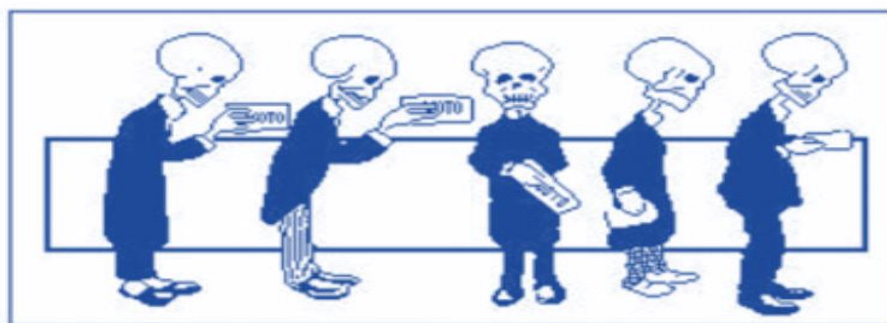
Detalhe da Charge Como se faz uma eleição , de Aamaro. Revista da Semana , nº 495, 1909, Rio de Janeiro. Biblioteca Nacional.

A charge apresenta uma crítica às eleições na Primeira fase da República no Brasil, a chamada fase oligárquica onde os coroneis eram, muitas vezes, acusados de falsificação das atas eleitorais, de alistamento de defuntos ou de comprar os componentes da mesa eleitoral.